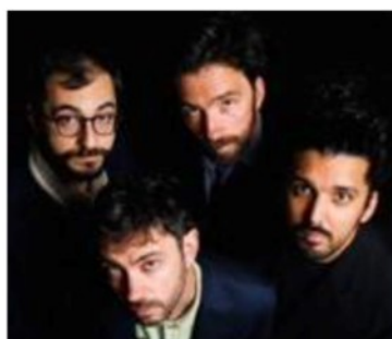
Il gruppo indie Ex-Otago, che hanno appena pubblicato il nuovo album