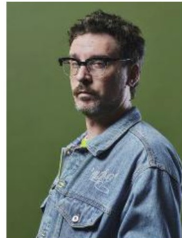
Willie Peyote, rapper e cantautore torinese