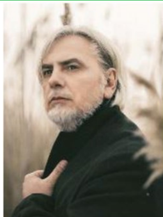
Paolo Benvegnù, chitarrista e cantautore