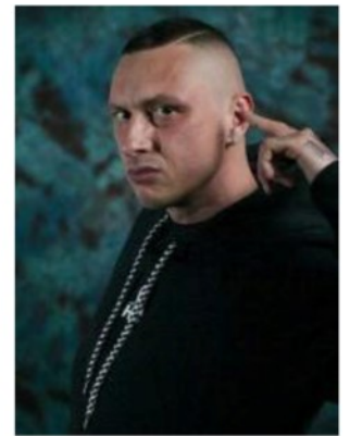
Inoki, rapper e produttore discografico italiano