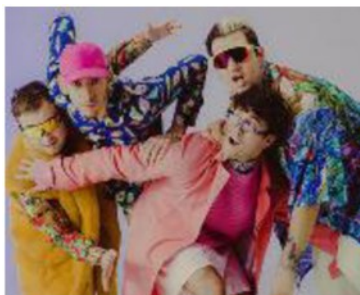
La band della 'bassa' Disco Club Paradiso