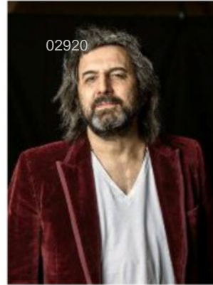
Omar Pedrini, cantante ed ex leader dei Timoria