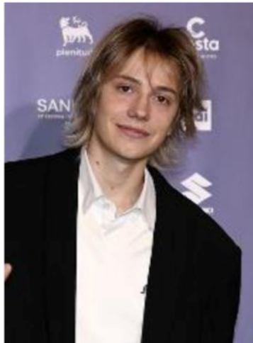
GIANMARIA, cantautore veneto, finalista di X Factor 2021